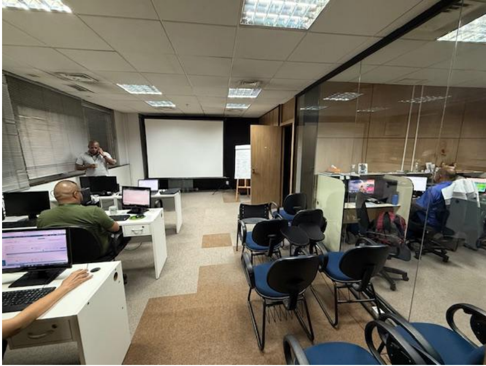
Figura 2 - Operações e Comunicação