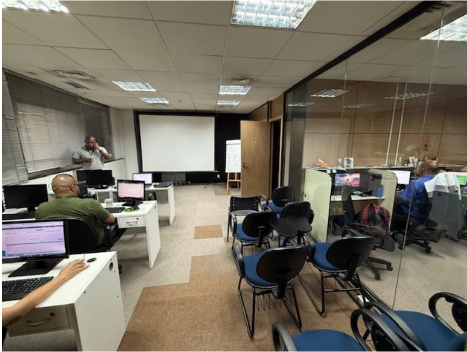
Figura 2 - Operações e Comunicação