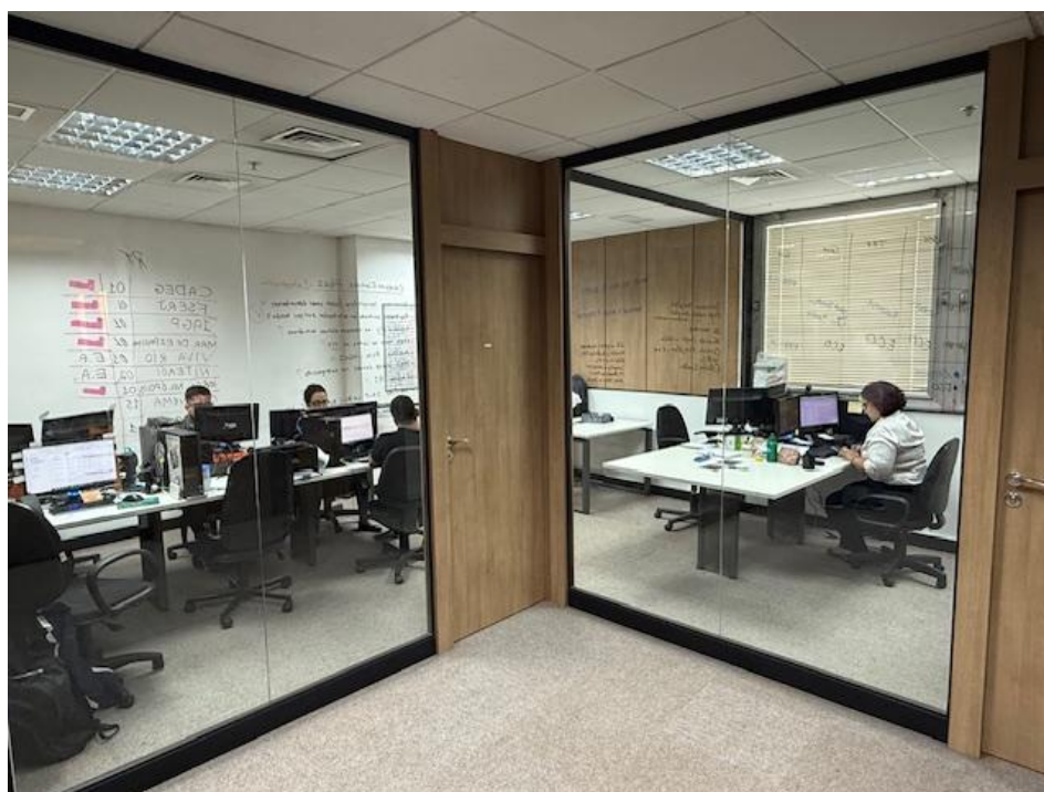
Figura 1 - Negócios

O Administrador Judicial, na diligência mais recente à sede das recuperandas - situada na Rua Gonçalves Dias, 51 – Centro, Rio de Janeiro, ocorrida em 06/05/2025, visitou as seguintes áreas de operação da empresa: