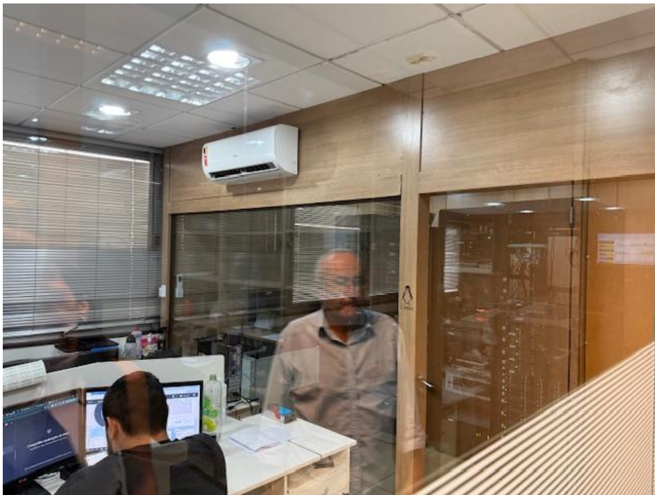
Figura 3 - Treinamentos