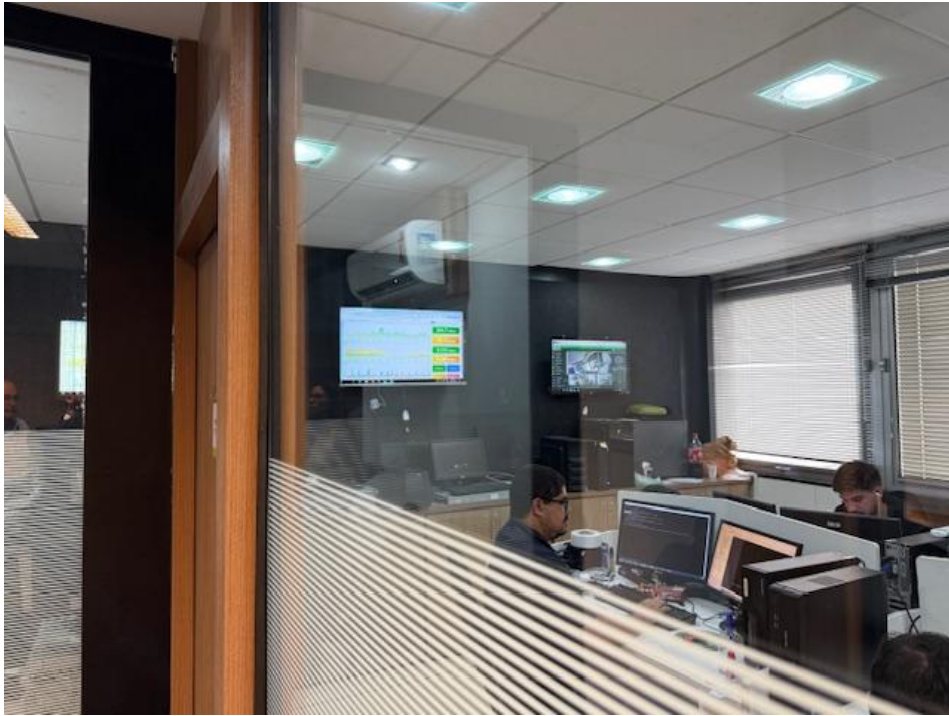
Figura 4 - Data Center e Service Desk