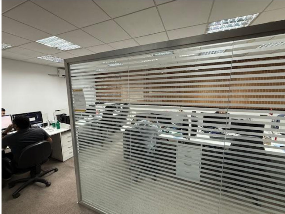
Figura 6 - Desenvolvimento