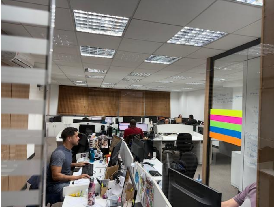
Figura 5 - Data Center e Service Desk