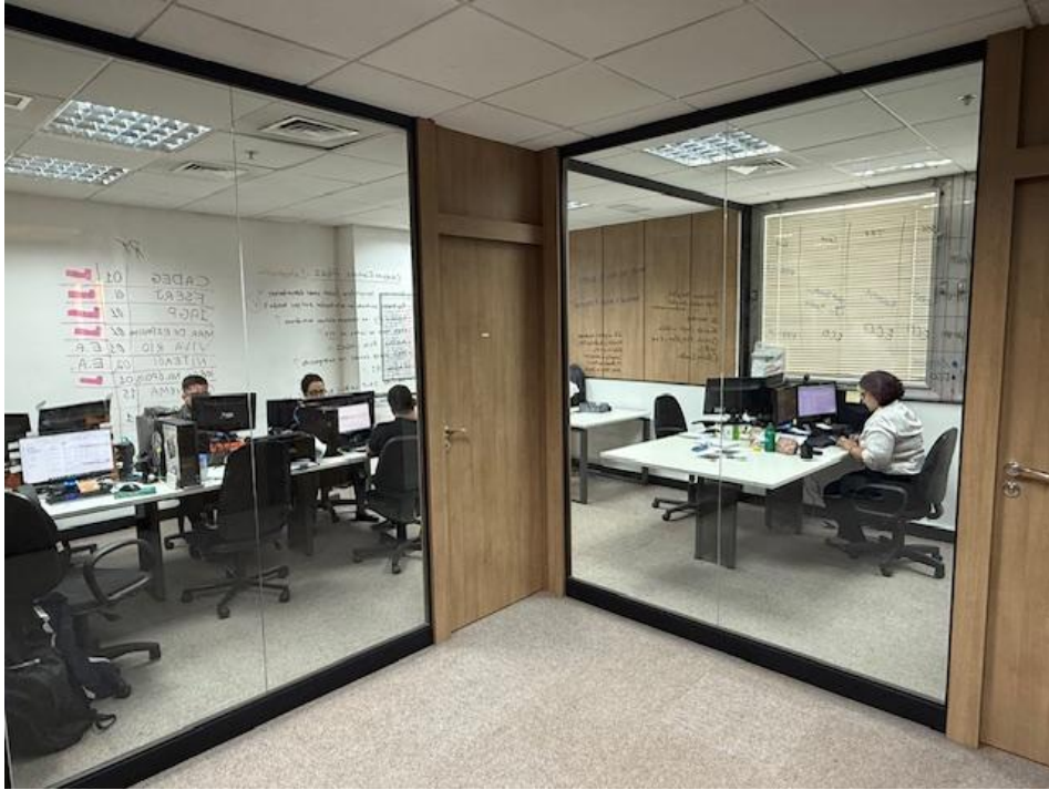
Figura 1 - Negócios