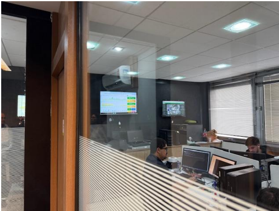
Figura 4 - Data Center e Service Desk