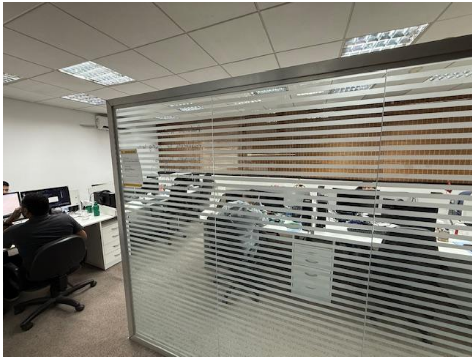
Figura 6 - Desenvolvimento