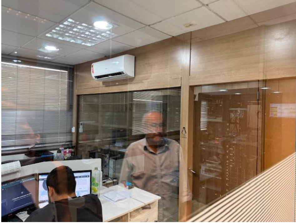
Figura 3 - Treinamentos